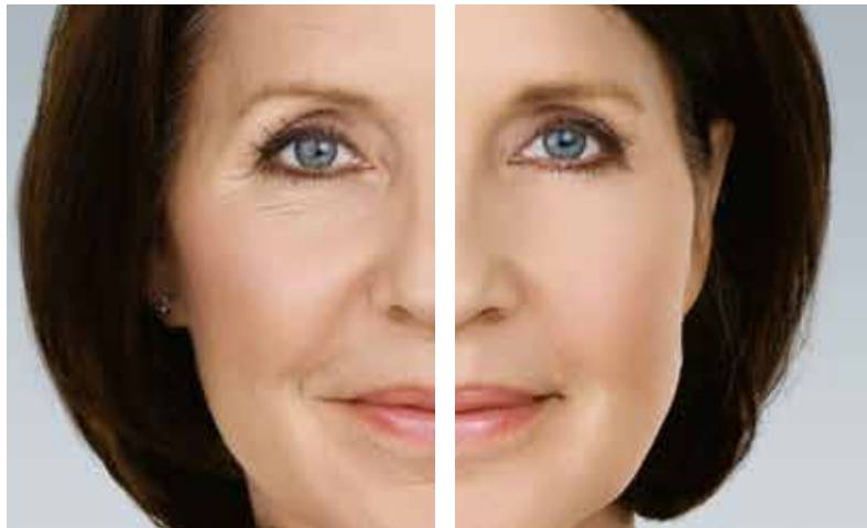
Vor der Faltenkorrektur

Finden Sie heraus, ob Botox® to go oder Hyaluron to go die richtige Wahl für Sie ist.