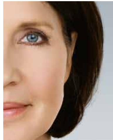
Nach der Faltenkorrektur*