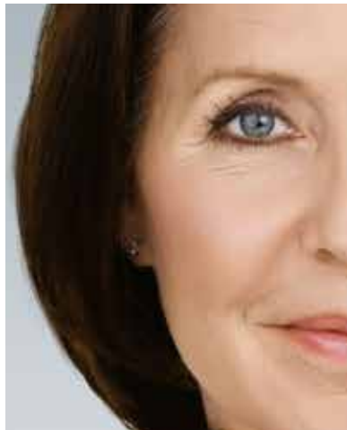
Vor der Faltenkorrektur

Finden Sie heraus, ob Botox® to go oder Hyaluron to go die richtige Wahl für Sie ist.